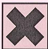
Nocif ou irritant